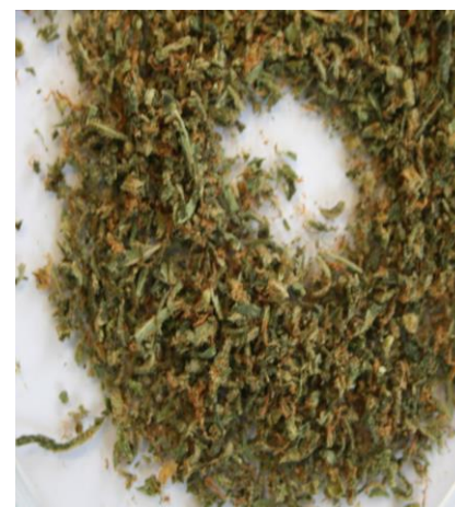
Drcená sušina konopí