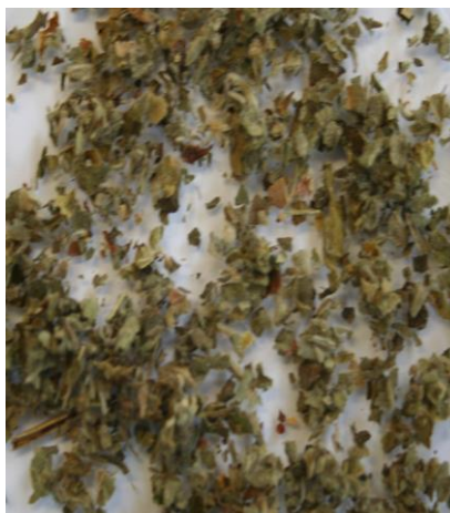
Obsah sáčku „BAKIBA“